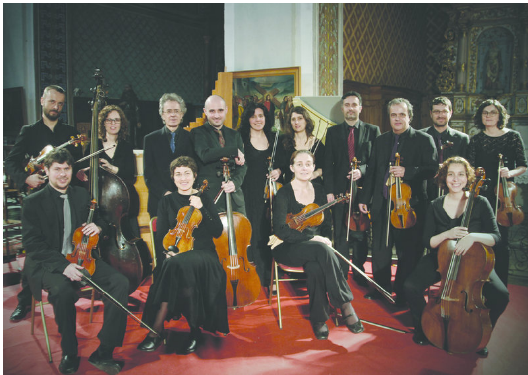
L'Orquestra Barroca Catalana